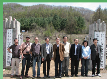
2011年5月10日，瑞士联邦森林、雪和景观研究所科学家访问清原站