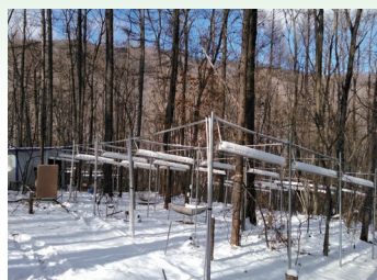
次生林生态系统野外增温试验平台