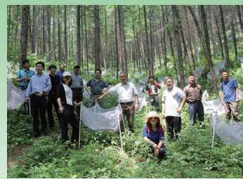
2017年6月16—18日，中科院野外站网络科研样地项目验收