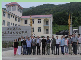
2014年6月25—26日，清原站召开创新三期建设项目验收会