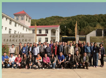
2016年10月1日，参加中国生态系统研究网络（CERN）第23次工作会议的部分代表考察清原站