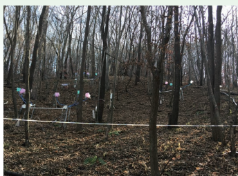
不同林型水源涵养功能研究样地——杂木林