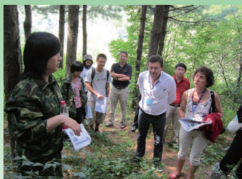
2011年8月26日，参加“中法生态系统固碳机制与调控研讨会”的部分专家与代表参观访问清原站